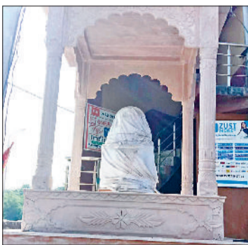
नारनौल। महाराज शूरसैनी की प्रतिमा, जिसका अनावरण सीएम करेंगे।