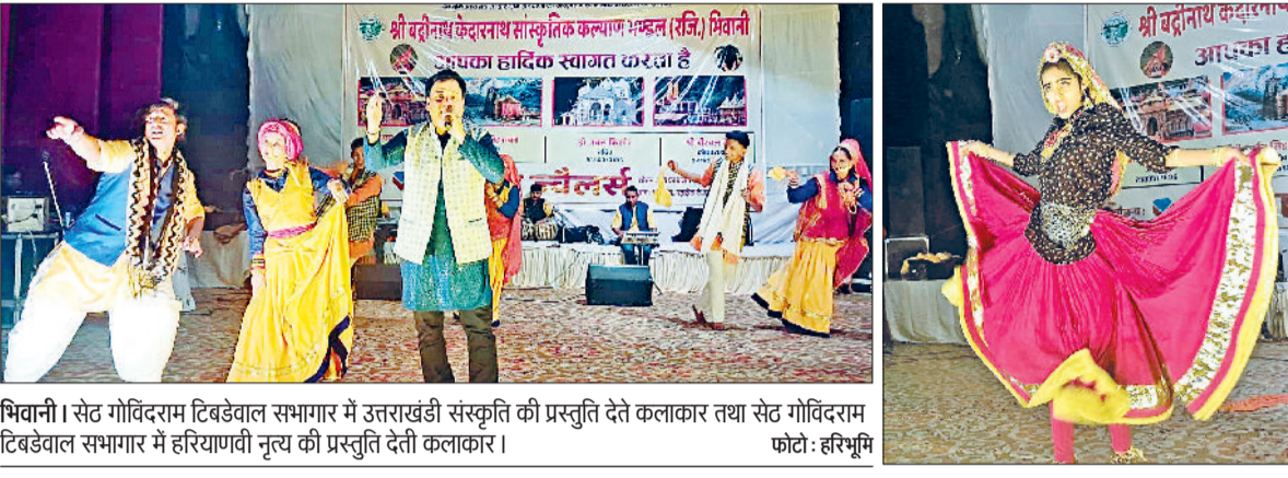
भिवानी। सेठ गोविंदराम टिबडेवाल सभागार में उत्तराखंडी संस्कृति की प्रस्तुति देते कलाकार तथा सेठ गोविंदराम टिबडेवाल सभागार में हरियाणवी नृत्य की प्रस्तुति देती कलाकार।