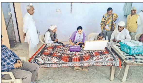
चरखी दादरी। शिविर में मरीजों की जांच करते चिकित्सक।