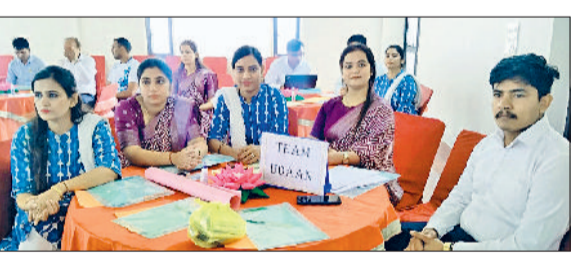
बवानी खेड़ा। आनंद स्कूल फॉर एक्सीलेंस मिलकपुर में कार्यक्रम में उपस्थित शिक्षक।

मिलकपुर स्थित आनंद स्कूल फॉर एक्सीलेंस मिलकपुर में शनिवार को वन डे कैम्पसिटी बिल्डिंग प्रोग्राम ऑन जेंडर सेंसिटिविटी का सफल आयोजन किया। कार्यक्रम का उद्देश्य शिक्षकों में लैंगिक संवेदनशीलता के प्रति जागरूकता बढ़ाना और उन्हें विद्यालयी परिवेश में समानता एवं सम्मान के वातावरण को प्रोत्साहित करने के लिए प्रशिक्षित करना रहा। कार्यक्रम