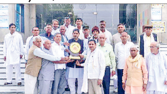
नारनौल। दानवीरों को सम्मानित करते हुए।