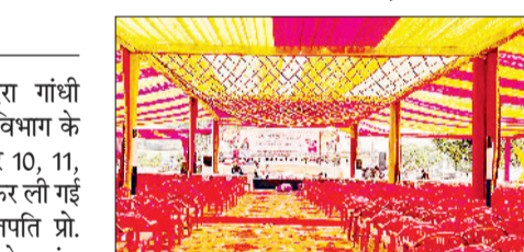
महेंद्रगढ़। कार्यक्रम को लेकर की गई तैयारियां।