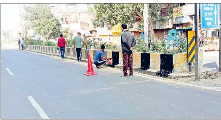
नारनौल। रेवाड़ी रोड पर डिवाइडर को रंग-रोगन करते मजदूर।