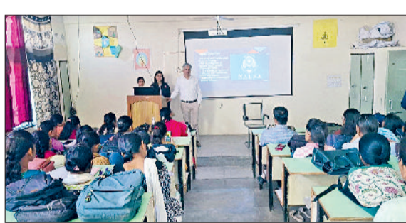
भिवानी। कानूनी जागरूकता कार्यक्रम को संबोधित करते वक्ता।