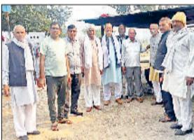
महेंद्रगढ़। सवामणी के अवसर पर उपस्थित ग्रामीण।